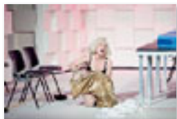
Arthur Miller Na de zondeval , tga.nl, t/m31/3